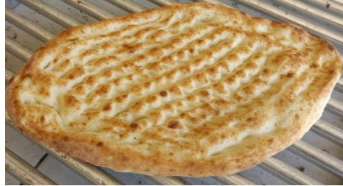
Resim 1. Antep Tırnaklı Pidesi

Yerel 3 farklı üreticiden alınan Antep Tırnaklı Pidesi üzerinde yapılan çalışmalar sonucunda aşağıdaki veriler elde edilmiştir (Tablo 1). Tablodaki veriler her ürün için 2 adet ve 2 tekrar ile elde edilmiş ve ortalama olarak verilmiştir. Kalınlık değerleri 2 adet ekmeğin kenarlarının farklı noktalarından alınan veriler ile elde edilmiştir. Tırnak aralığı ise 6 adet farklı tırnak aralığının ortalaması olarak verilmiştir. Renk değerleri Hunter Lab Colorimeter kullanılarak ekmeğin 6 farklı noktasından alınmış ve ortalama hesaplanmıştır.