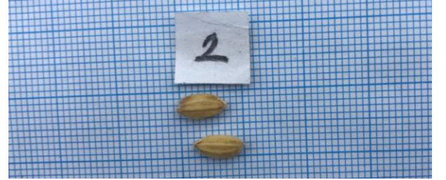
Şekil-3: Yaşar çeltik çeşidi