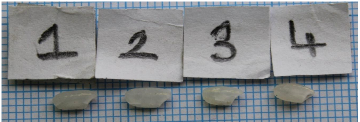
Şekil-6: Sarıklık pirinç çeşidi ile Akçeltik, Yaşar ve Maratelli genotiplerin görsel karşılaştırması