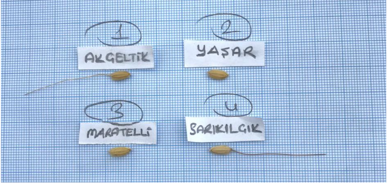
Şekil-1: Sarıklık genotipi ile Akçeltik, Yaşar ve Maratelli genotiplerin görsel karşılaştırması

5996 Sayılı Veteriner Hizmetleri, Bitki Saęlığı, Gıda ve Yem Kanunu "Gıda Kodeksi" başlıklı 23 üncü maddesi çerçevesindeki denetimler Gıda, Tarım ve Hayvancılık Bakanlığı tarafından gerçekleştirilecektir.