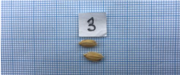
Şekil-4: Maratelli çeltik çeşidi