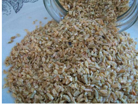
Resim 1. Tüketilmeye hazır Antep Firiği