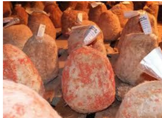
Obrukta Olgunlaştıktan Sonra