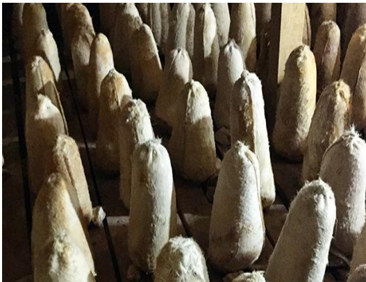
Obruğa Konulduktan Hemen Sonra

Elde edilen peynir temizlenip hazırlanan keçi veya kuzu tulumlarına arada hava kalmayacak şekilde sıkıca doldurulur. Tulumların büyüklüğüne göre kilogram başına 2 kez olmak üzere tulumlar şişlenir. Şişlemenin amacı peynirin bünyesinde kalan peynir altı suyunun uzaklaştırılmasıdır. Ağızları dikilen tulumlar serin bir alanda ve kum üzerinde su sızdırmaz duruma gelene kadar (yaklaşık 8-10 gün) bekletilir. Bu bekleme süresinin sonunda da aşağıda örneği verilen obruk fişine üreticinin adı-soyadı, tulumun kilosu, cinsi, obruğa giriş tarihi yazılarak obruğa götürülür. Obruk bekçisinin nezaretinde ürünün obruk defterine kaydı yapılır. Obrukta uygun bir yere yerleştirilir. Ağırlıkları 1,5 kilograama eşit veya küçük olan tulumlar en az 90 günde; ağırlıkları 1,5 kilogramdan fazla olanlar en az 120 günde olgunlaşır ve haziran ayı başından ekim ayının sonuna kadar obrukta yaklaşık 5-6 ay bekletilir. Obruktan çıkarılan ürünler tulumları açılmadan satışa sunulur.